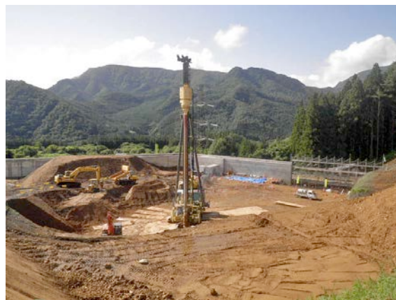
地盤改良(エポコラム工法)施工状況