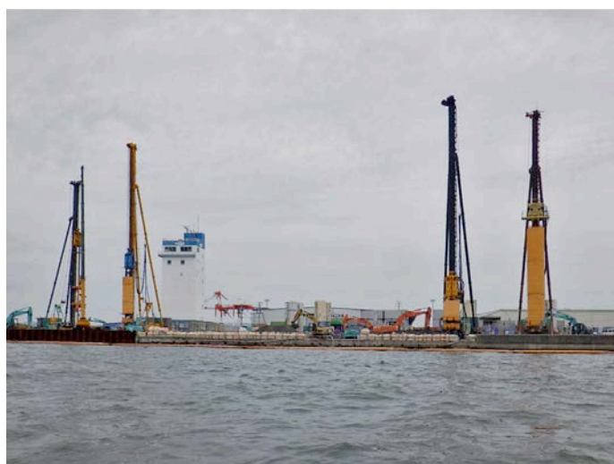
地盤改良(CDM・CDM-LODIC・エポコラム LOTO・エポコラム pls 工法)施工状況