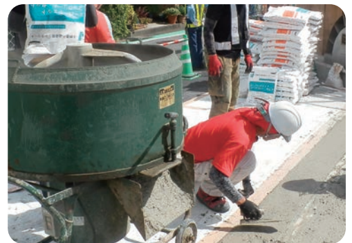
伸縮装置での使用例