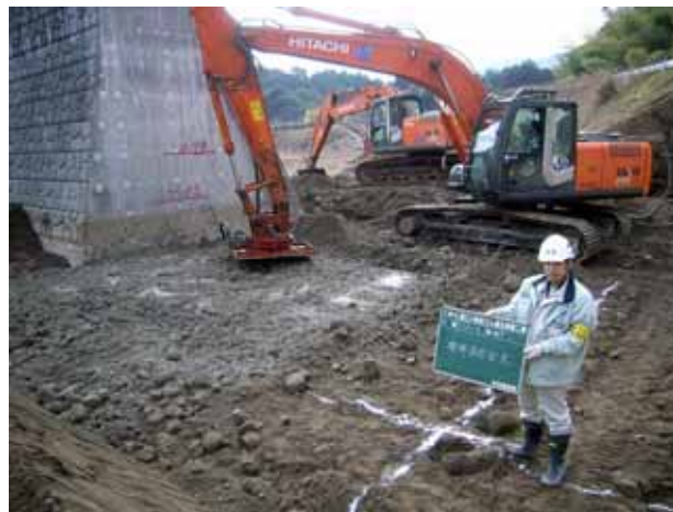
現位置攪拌混合固化工法（ISM工法） 施工状況

当現場では、砂防えん堤の本体構造部のコンクリート工事にて、現場発生土を有効利用する現位置攪拌混合固化工法（ISM工法）を施工し、専門技術の維持と向上に貢献したことが高く評価されました。