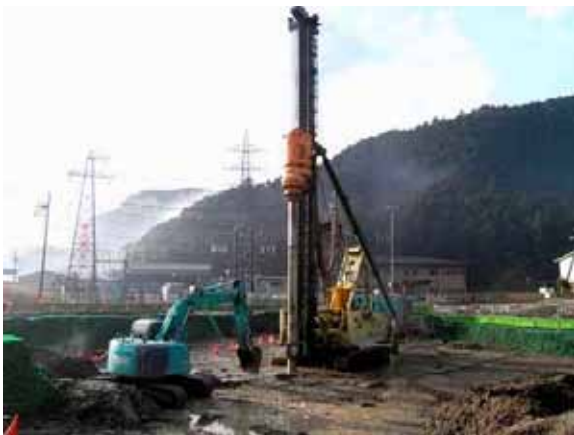
地盤改良施工状況

当現場では、深層混合処理工法(エポコラム工法)による地盤改良工事を施工し、専門技術の維持と向上に貢献したことが高く評価されました。