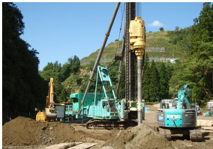
地盤改良（エポコラム工法）施工状況