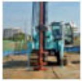
ウルトラコラム工法