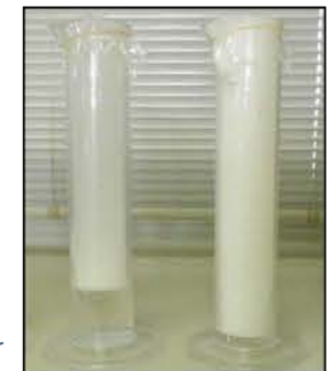
左: 従来品 Bタイプ 右: TS-foam