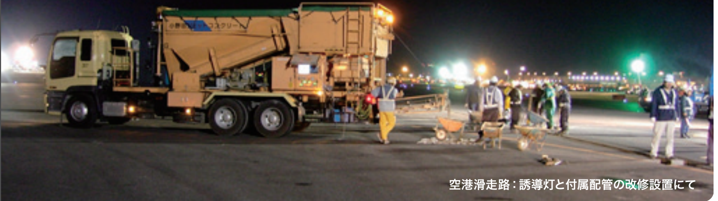
空港滑走路：誘導灯と付属配管の改修設置にて

重量計量制御・バッチ式の移動プラント車により コンクリート製造・品質の信頼性向上を実現します。