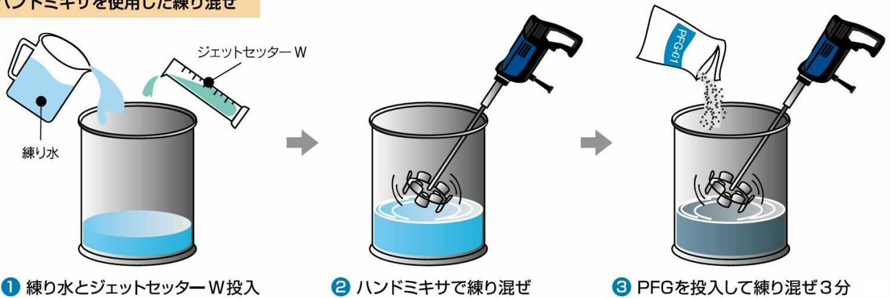
① 練り水とジェットセッターW投入